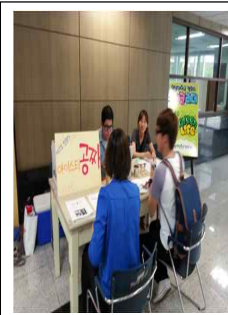
머그컵 캠페인, 나무심기