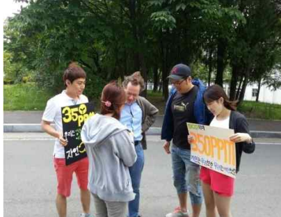
상추 새싹 나눠주기