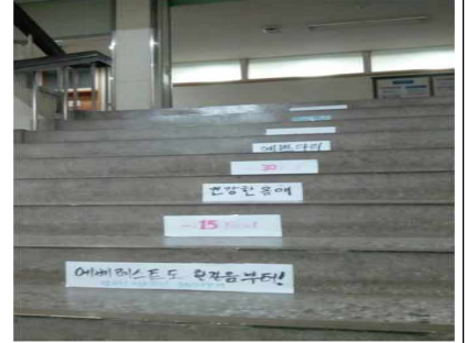
세탁기 같이 돌리기, 계단 이용 독려