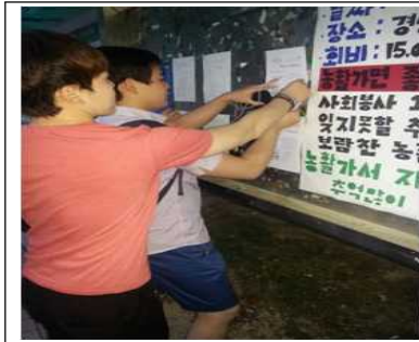
매월 환경 신문 제작