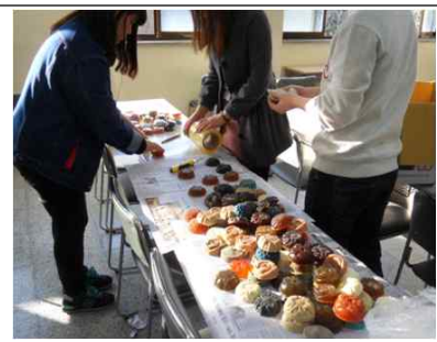
천연 비누·화장품 제작