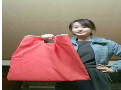
부채 나눠 주기, 에코백 제작